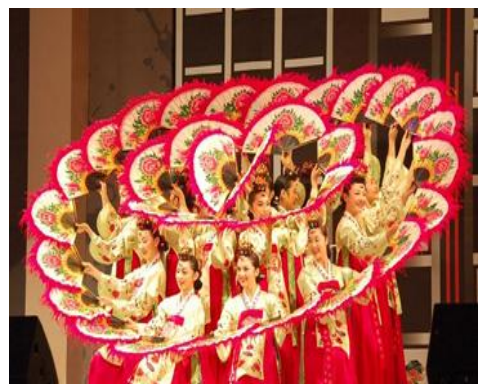
韩国的传统民俗文化